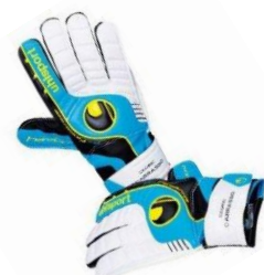
mes gants de foot